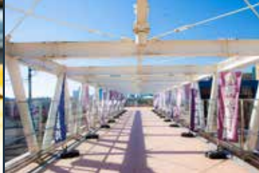
Odawara-bashi Building 3F 小田原橋棟 3F