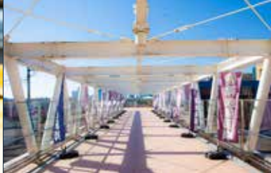
Odawara-bashi Building 3F 小田原橋棟 3F

16-16-2, Tsukiji 4-chome, Chuo-ku, Tokyo 104-0045, Japan https://www.tsukiji.or.jp/english/ Contact : Tokyo Unique Venues TEL : +81-3-5579-8870 E-mai : tokyouuniquevenues@tcvb.or.jp